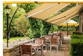
Seiterrasse & Außenbereich