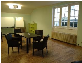
Zwischendeck ca. 20 m 2 (1.OG)

Unser großzügiger Außenbereich eignet sich hervorragend für Team-Events und Team-Building oder auch als „Pausenraum“ um frische Luft und neue Energie zu tanken. Gemeinsam mit unseren Trainern können hier Yoga-Sessions stattfinden oder es geht eine Runde in den schönen Sachsenwald zum Waldbaden.