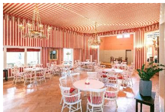
Festsaal (EG) ca. 120 m 2