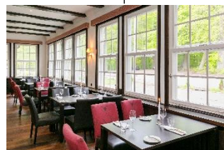
Salon (EG) ca.45 m 2